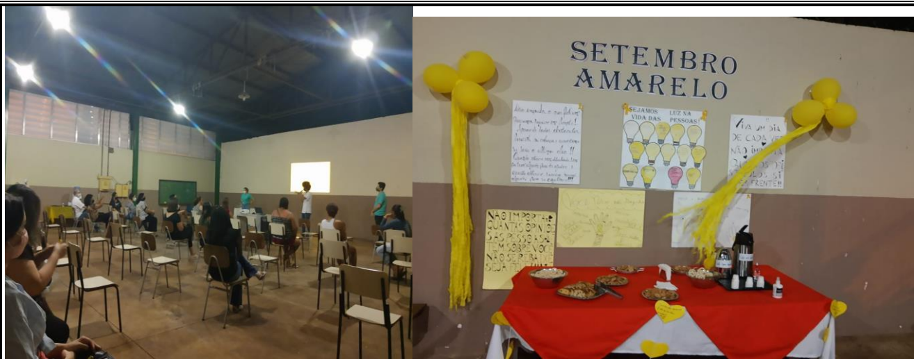
Data: 30/09/2021 – Comemoração dos Aniversariantes do mês Setembro