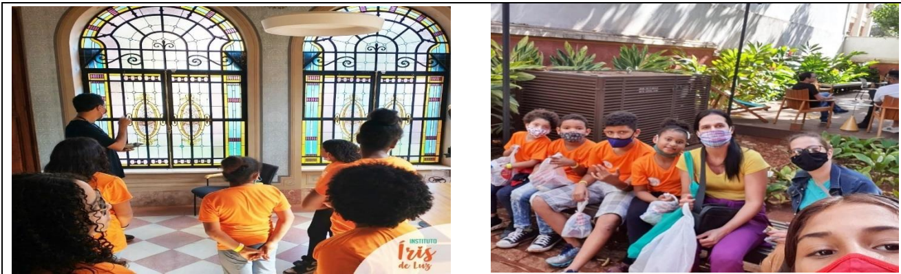
Reunião de equipe – 26/07/2022